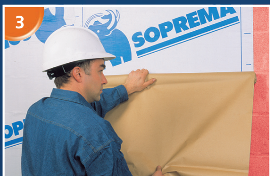
En prenant soin de bien aligner la membrane retirer graduellement le film siliconé détachable, tout en s'assurant que la membrane est complètement adhérente.