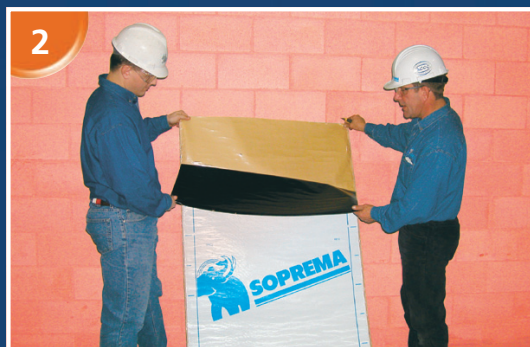
Retirer la partie supérieure du film siliconé détachable.