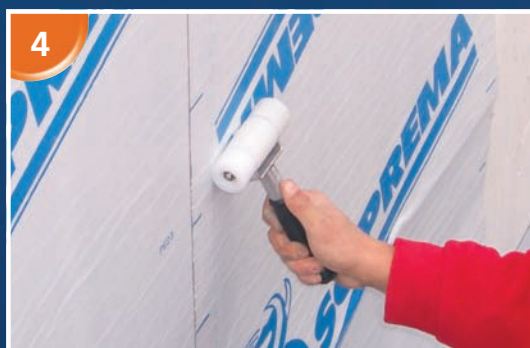
L'utilisation d'un rouleau maroufleur est fortement recommandée afin d'éviter les poches d'air.