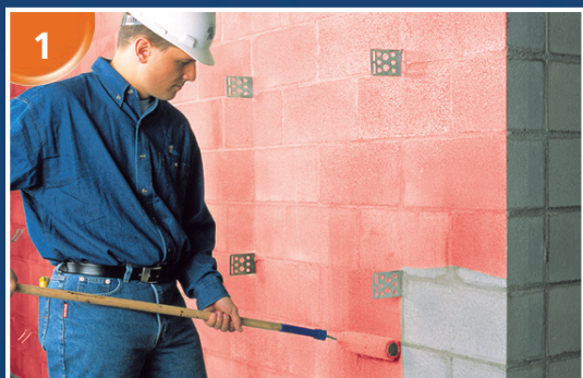
Appliquer l'apprêt ÉLASTOCOL STICK sur la surface.