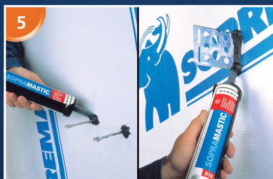
Utiliser SOPRAMASTIC pour sceller les détails et les zones critiques.